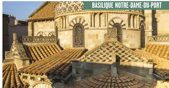
Notre-Dame-du-Port, détail du chevet