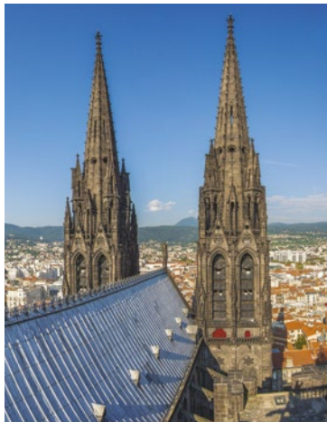
Cathédrale de Clermont

► Lundi, mercredi et vendredi : 15 h Départ : Rendez-vous devant la Maison du Tourisme, place de la Victoire.