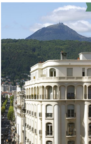
Immeuble Art Déco sur fond de puy de Dôme

► Dimanche : 15 h Départ : Rendez-vous devant la Maison du Tourisme, place de la Victoire.